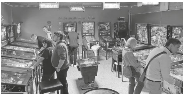
Viel Spaß hatten die Vereine im Flippermuseum

Der nächste Termin im Flippermuseum am 16. November ist bereits ausgebucht. Dafür sind im Dezember zwei Termine geplant. Einer davon wird auch wieder zwischen den Jahren stattfinden. Da kann dann die ganze Familie kommen.