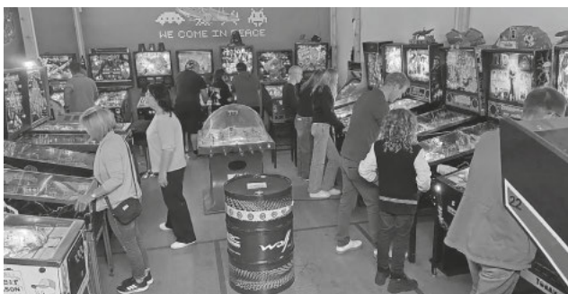
Fast alle Geräte waren in Betrieb. Viel Spaß hatten die Teilnehmer beim Flippern